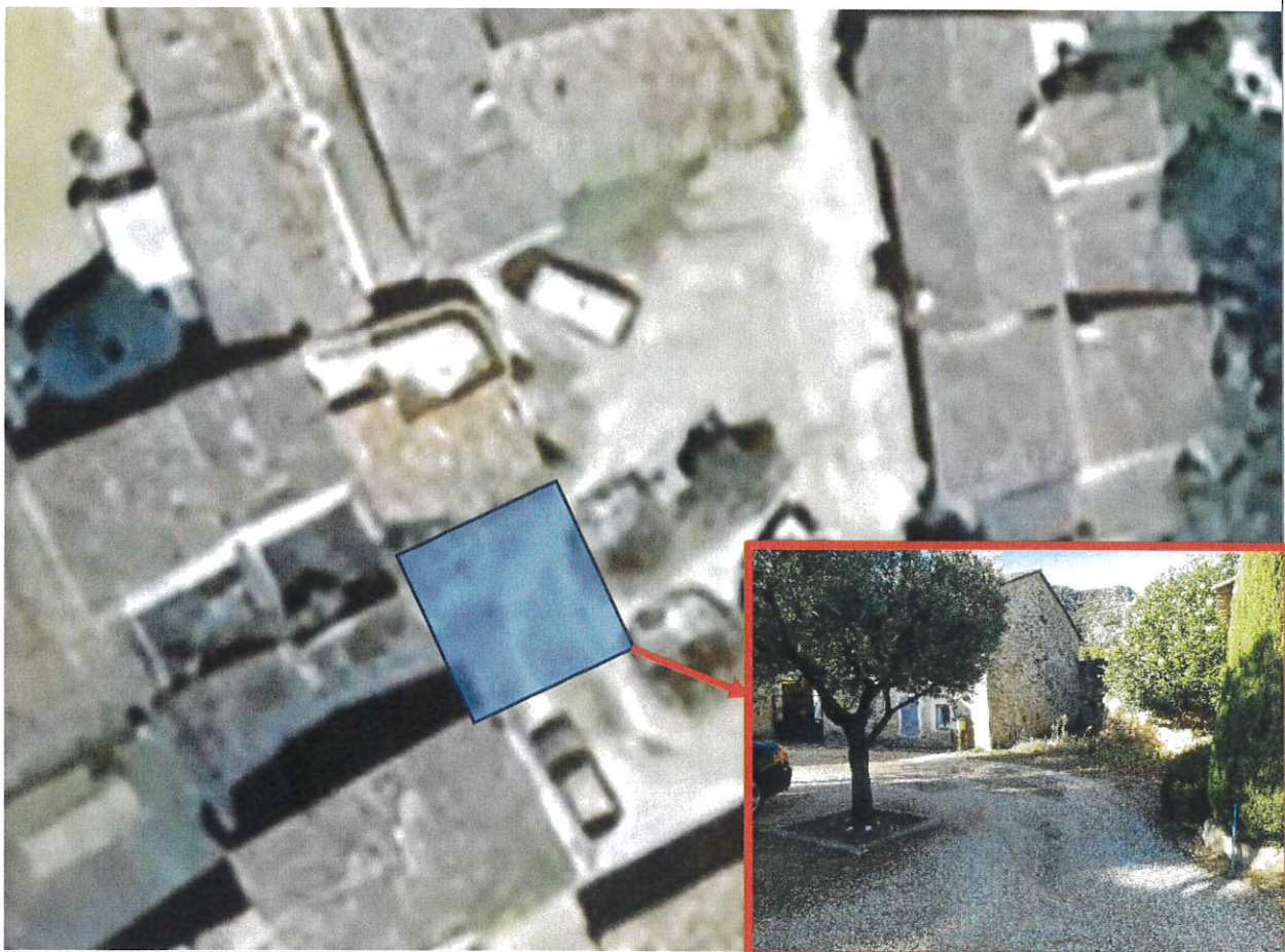
Place des Rigons