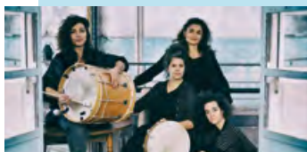
Mercredi 24 juillet : LA MOSSA (vois et percussions) BLEU COYOTTE (Bluegrass)

Billetterie : www.billetterieaveclagare.org : 12€/soirée, 24€ pour les 3 soirs. Chiens interdits.