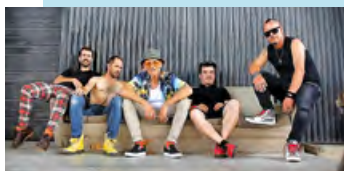
Jeudi 25 juillet : OAI STAR (Rock festif) précédés de PASTEUR GUY (DJ Set)